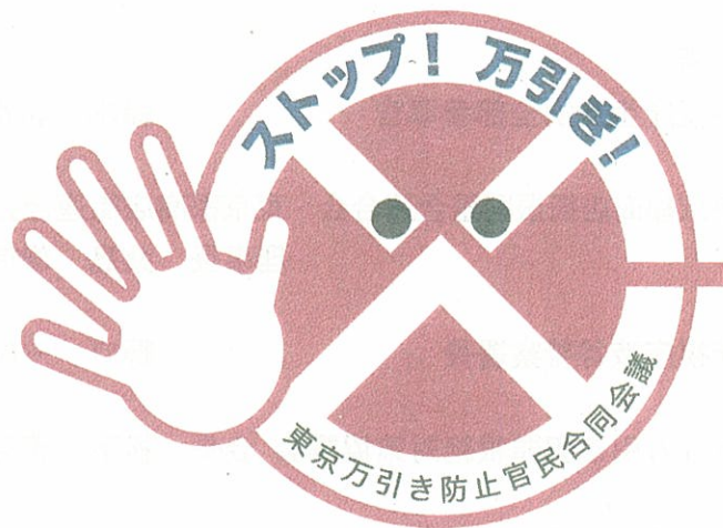
【万引き防止広報用ロゴマーク】