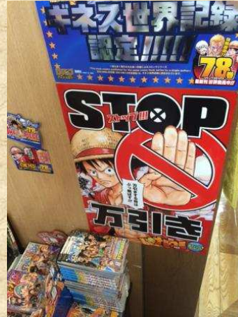
書店コミックコーナー