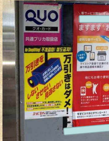
ドラッグストア店頭