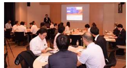
第 1 回（第 1 章）5 月 16 日

第 1 回（1 章「従業員の不正」）が 5 月 16 日（水）に開催され 40 名が参加されました。（一社）新日本スーパーマーケット協会 増井副会長など小売業の方、防犯メーカー・警備業、警察関係者、さらには渥美先生が参加され、意見交換が行われました。第 2 回 6 月 20 日（水）は、さらに具体的な事例紹介があり 意見交換が進みました。